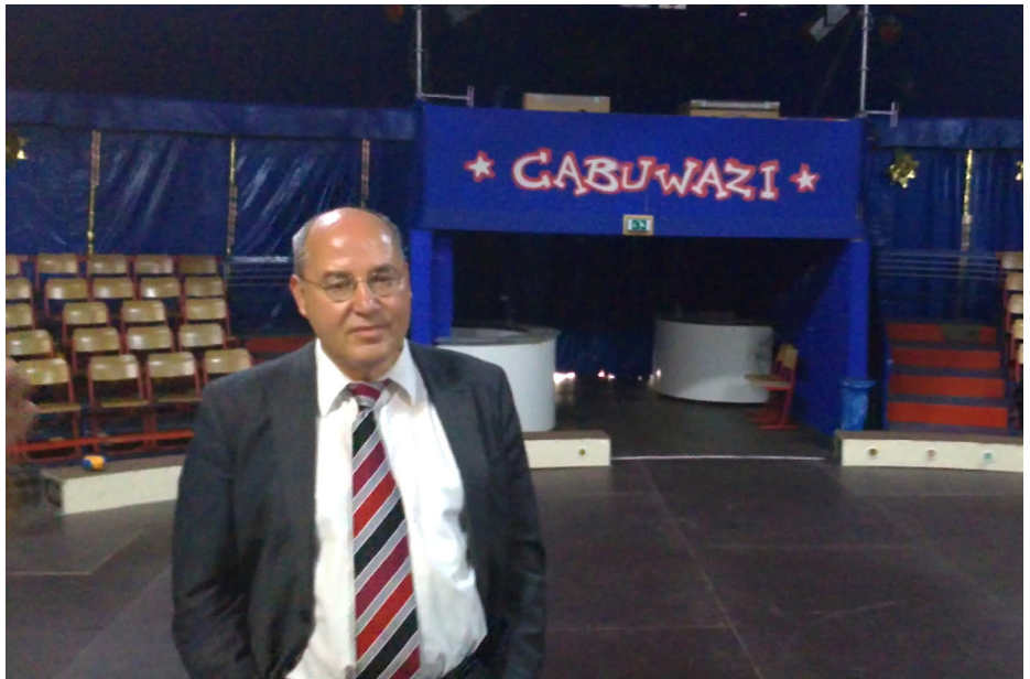
Unterwegs in Treptow-Köpenick: Am 14. Juni war ich gemeinsam mit Gregor Gysi zu Besuch beim Kinder- und Jugendzirkus CABUWAZI in Altglienicke.

Auch die notwendigen Lärmschutzmaßnahmen werden nicht gänzlich eine Einschränkung der Lebensqualität vermeiden können. Deshalb kann ich nachvollziehen und verstehen, wenn die vom Fluglärm betroffenen Bürgerinnen und Bürger ein Nachtflugverbot von 22 bis 6 Uhr wollen.